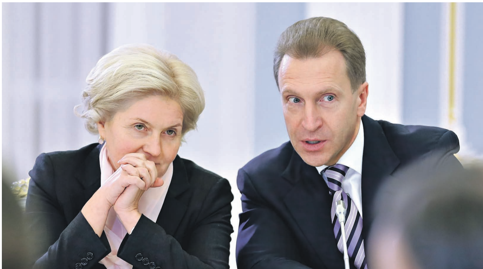
Спор социального блока правительства с экономическим об индексации пенсий завершен. На очереди — заморозка накоплений и повышение пенсионного возраста (на фото — социальный вице-премьер Ольга Голодец и экономический вице-премьер Игорь Шувалов)

ПЕТР НЕТРЕБА, СИРАНУШ ШАРОЯН, ИВАН ТКАЧЕВ