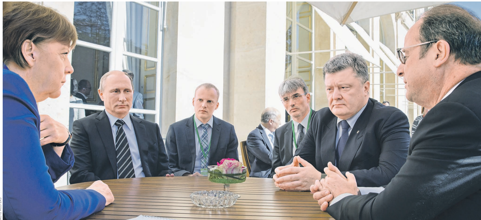
По итогам встречи Франсуа Олланд (справа) и Ангела Меркель (слева) заявили о «подвижках» в переговорном процессе и некотором сближении в позициях Петра Порошенко и Владимира Путина (вторым справа и вторым слева)

Голосование в ДНР и ЛНР стало основным спорным вопросом на встрече «нормандской четверки»