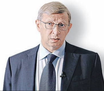
Владимир Евтушенков, владелец АФК «Система»

Доля в «Медси» может быть продана стратегическому инвестору