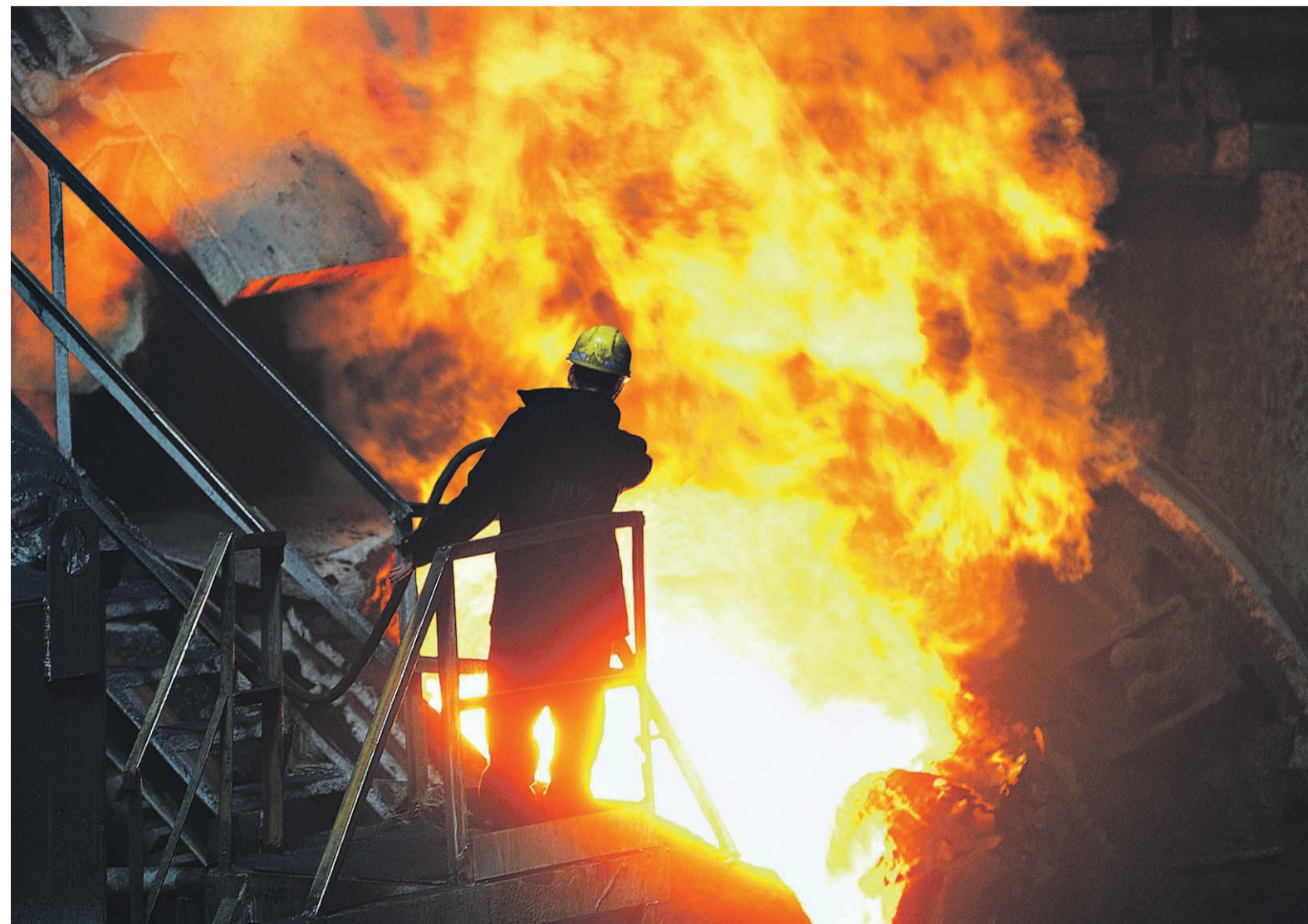
За первое полугодие 2015 года «Норильский никель» заплатил 32,7 млрд руб. НДС — это не более 1,5% от годовой выручки компании. (На фото — плавильный цех на Медном заводе ГК «Норильский никель»)