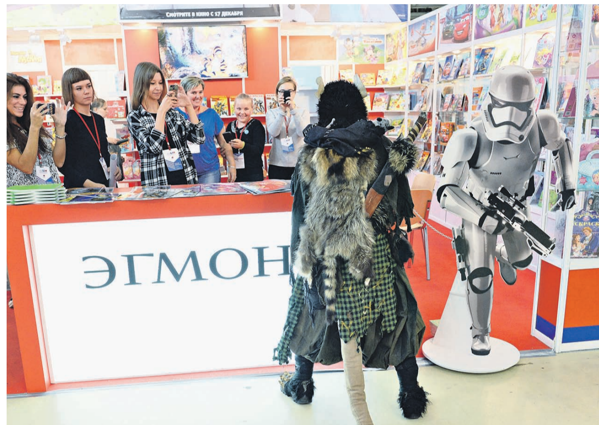
Оборот российского отделения Egmont, издающего книги и журналы про Лунтика, Барби и других популярных персонажей, в 2014 году составил 1,66 млрд рублей

Egmont вышла на российский рынок еще в конце 1980-х, создав СП с издательством «Физкультура и спорт», потом, в 1992 году, открылось полноценное представительство датского концерна, напоминает Елин. По его словам, российский бизнес прибылен,