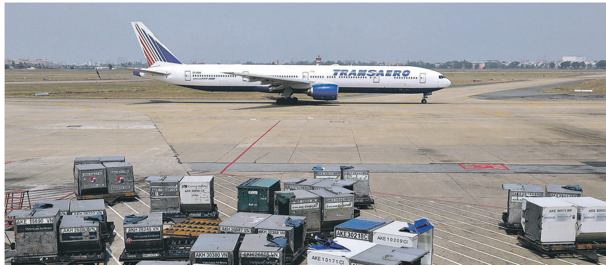
«Аэрофлот» продолжит развозить пассажиров «Трансаэро» до 15 декабря 2015 года