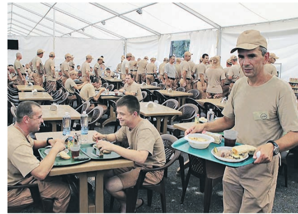
← За последние три дня российские летчики совершили около 60 вылетов. На фото — в столовой на авиабазе Хмеймим

вейшие российские самолеты Су-34 (на базе в Латакии в сентябре были замечены шесть таких машин). В отличие от штурмовиков Су-25 бомбардировщики Су-24М и Су-34 использовали во время налетов высокоточное и более мощное оружие — корректируемые авиабомбы КАБ-500 и бетонобойные авиабомбы БЕТАБ-500,