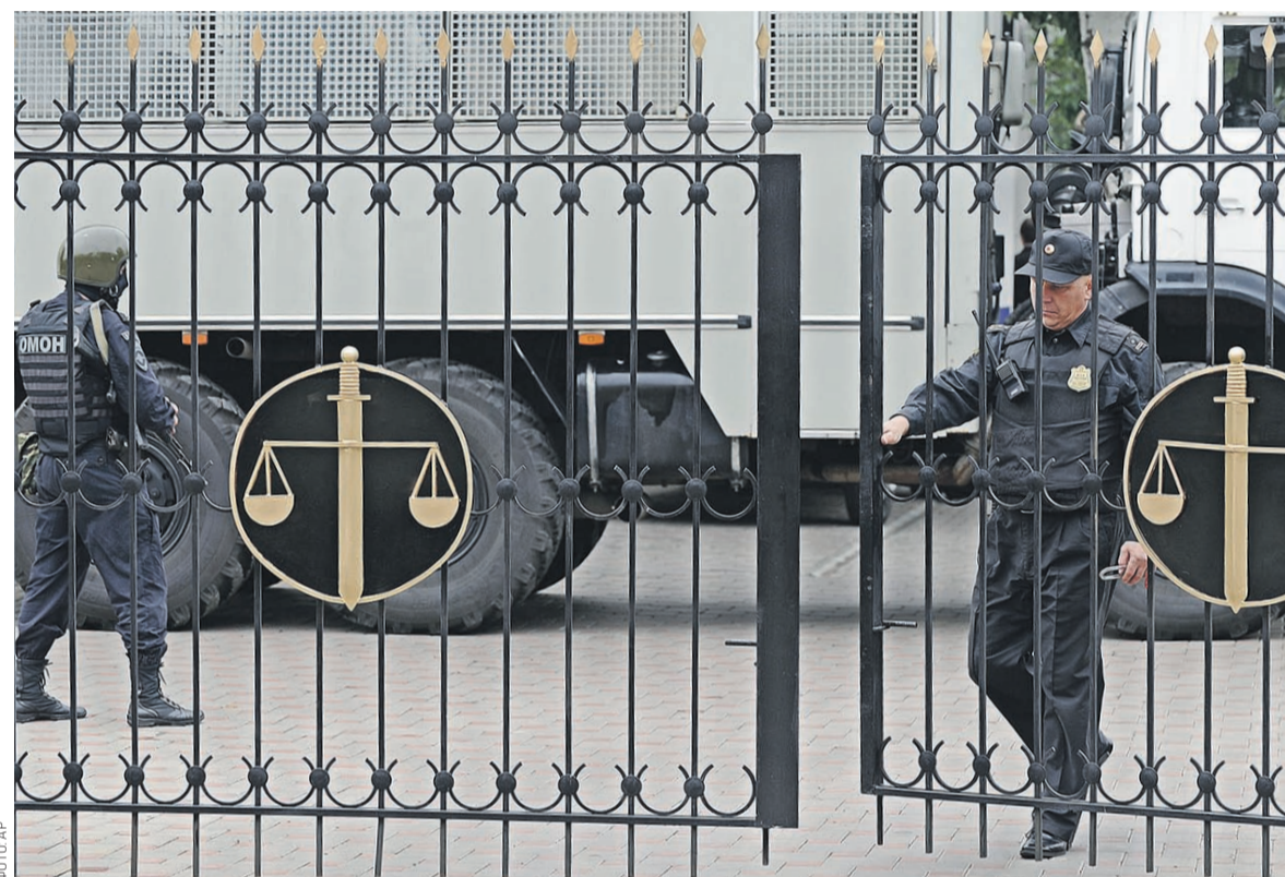
Рост дел в отношении взяткодателей может быть связан с провокациями со стороны правоохранительных органов