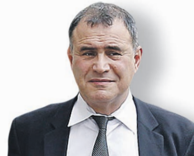
НУРИЭЛЬ РУБИНИ, председатель Roubini Global Economics, профессор экономики в Бизнес-школе Стерна при Нью-Йоркском университете